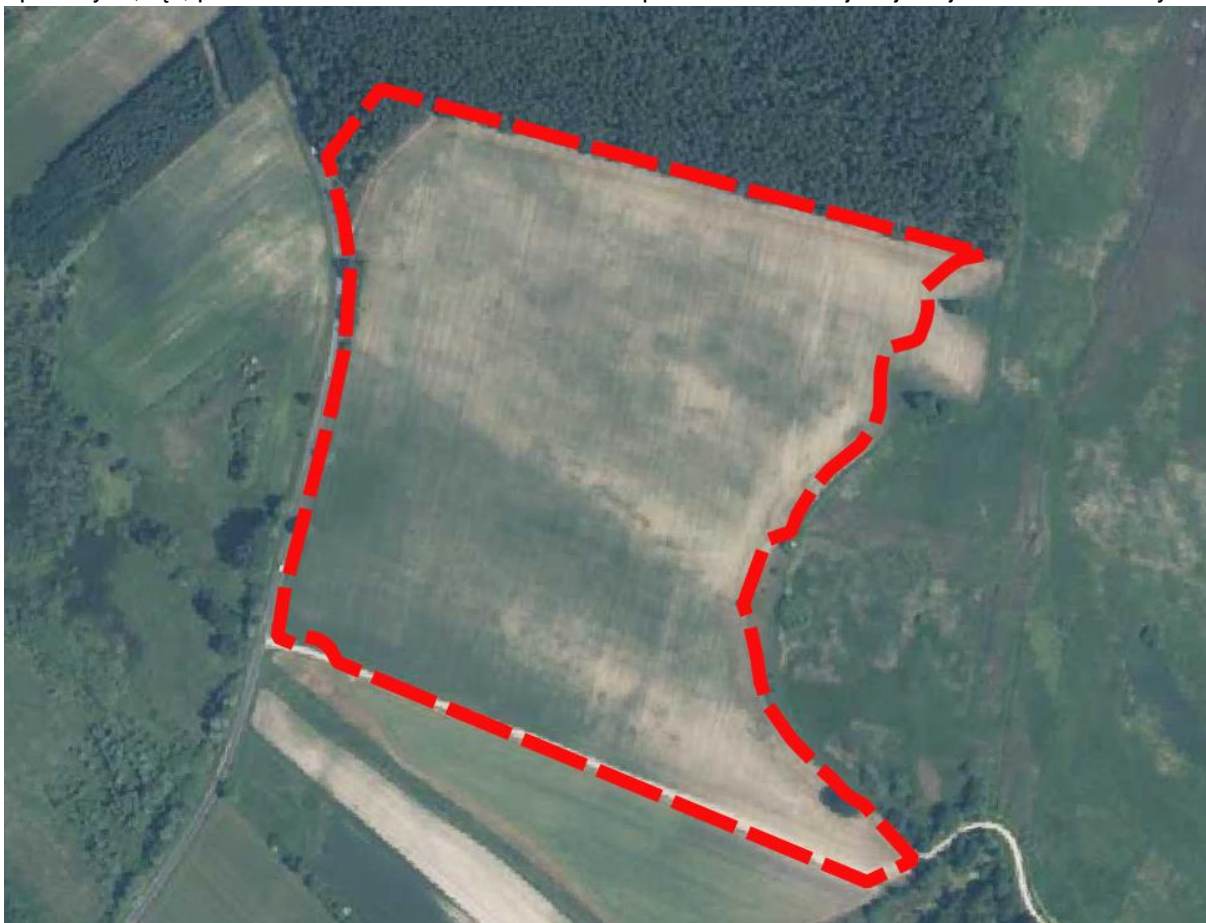
Rysunek 2 Położenie obszaru opracowania na ortofotomapie

W krajobrazie obszaru opracowania i jego otoczeniu dominują tereny otwarte w formie pól uprawnych, łąk, pastwisk i zadrzewień. Na obszarze opracowania brak jest jakiegokolwiek zabudowy.